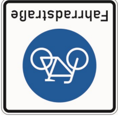
StVO Verkehrszeichen 244: